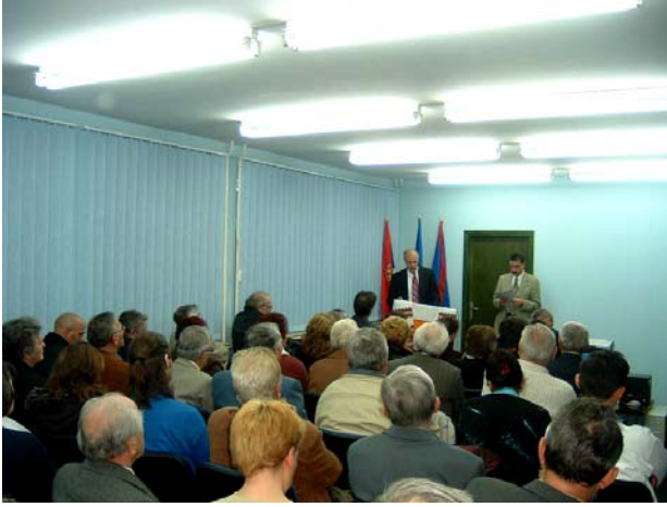
На світлинах: Представники української громади Сербії на вечорі, присвяченому пам'яті жертв Голодомору

шляхом конфіскації продовольства. Він також розповів про заходи Президента України Віктора Ющенка і влади щодо визнання Голодомору геноцидом українського народу та наголосив на важливості ролі української діаспори у визнанні Голодомору геноцидом українського народу, зазначивши, що незалежна Україна існувала і існуватиме завжди. Народ, який не зламався, житиме завжди!