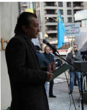
Рустем Ірсай, Президент Канадської асоціації кримських татар