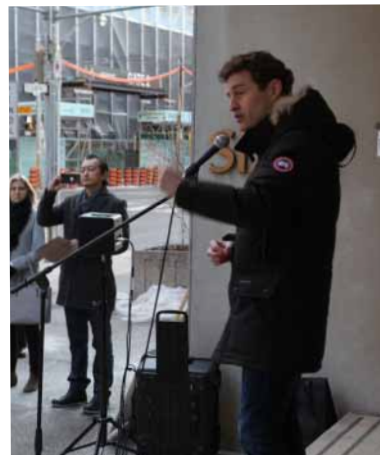
Іван Бейкер, депутат парламенту Канади

У заході взяли участь провідники та активні діячі української громади Торонто, депутати федерального парламенту Канади Іван Бейкер та Пітер Кент.