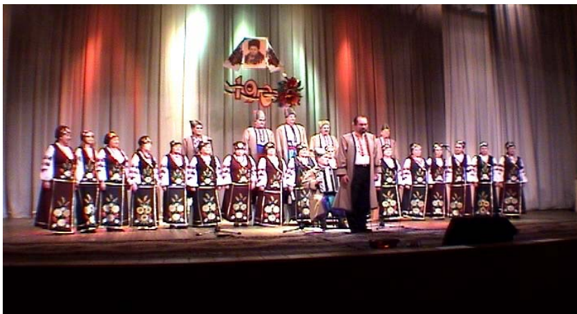
Народний хоровий колектив Павлодарського товариства української культури

Апогеєм святкових заходів на честь ювілею Т. Г. Шевченка стала літературно-музична композиція “І, чужому научайтесь, й свого не цурайтесь”. Для проведення цього дійства українцям було виділено головну сцену міста – міський Палац культури. Уже в просторому вестибюлі гостей зустрічав лагідний погляд Тараса з чудового портрета, який прибув до павлодарців з батьківщини Шевченка – мальовничої Черкащини. А заповітні рядки “...і мене в сім'ї великій...” закликали до чудової виставки картин на Шевченківську тематику павлодарського художника, члена товариства – М. Ткача і заслуженого художника України з Семипалатинська – Олександра Шевченка.