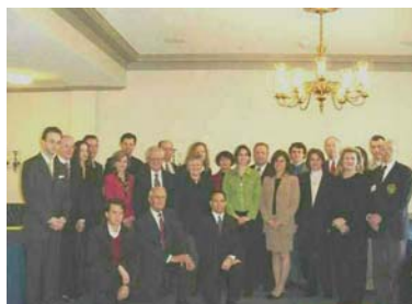
Учасники “Українських Днів” під час сніданку з Конгресовим Українським Кокусом

Вашингтон, ДК (УНІС) – 24-го та 25-го березня цього року Українська Національна Інформаційна Служба (УНІС), вашингтонське бюро громадських відносин УККА, організувала та провела у Вашингтоні “Українські Дні”. Це дозволило представникам відділів УККА з усіх кінців США приїхати до Вашингтону, познайомитися з основними чинниками в сфері формування політики США щодо України, познайомитися з їхніми поглядами на сучасну ситуацію та перспективи розвитку відносин між двома країнами, а також зустрітися зі своїми представниками в Палаті Представників та Сенаті США і звернути їхню увагу на питання, які турбують нашу громаду. Цього року в “Українських Днях” брали участь представники громади з Баффало (НЙ), Йонкерс (НЙ), Нью-Йорку (НЙ), Лос Анджелесу (Каліфорнія), Філадельфії (Пенсильванія), Детройт (Мічиган), Вірджинії (Конектикат), Делаверу та Нью-Джерзі. В засіданнях також брали участь представники Фундації “Україна–США”, Підприємницької ради Україна–США, та студенти деяких навчальних закладів у метрополії Вашингтоні.