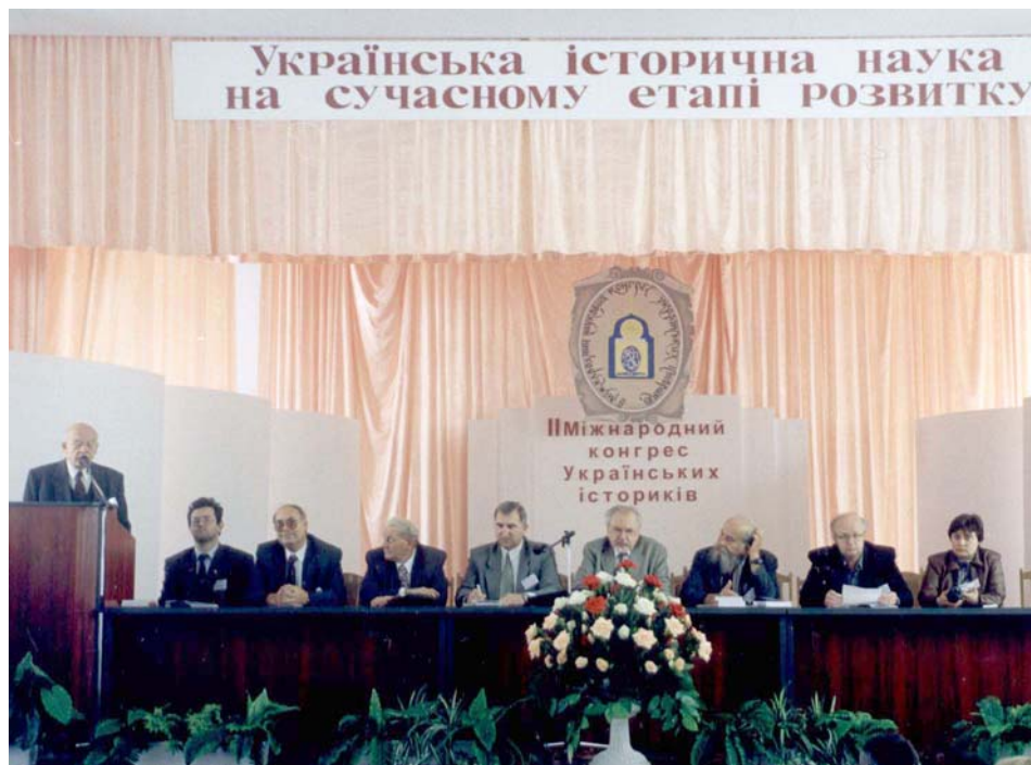
Президія Міжнародного конгресу істориків в Кам'янці-Подільському

Важливо відзначити участь значної кількості молодих істориків з України у цьому важливому Конгресі, де було обговорено важливі питання української історичної науки на сучасному етапі розвитку. Окремі доповіді були присвячені науковому життю в діяспорі і співпраці наукових установ і університетів в розбудові наукового українознавства, зокрема української історичної науки. На Конгресі гідно відзначено 40-ліття “Українського Історика”, єдиного міжнародного історичного журналу УІТ, в якому співпрацюють українські вчені з діяспори і України. На Конгресі голова і члени Світової Наукової Ради мали змогу поглибити зв'язки з численними академічними установами. Одночасно заплановано періодично проводити конференції, присвячені розвитку наукового життя в діяспорі і взагалі окремим історичним проблемам української спільноти в Америці, Канаді, Європі, Австралії і Східній українській діяспорі. Тепер готується 5 наукових збірників з доповідями й іншими конгресовими матеріалами. Віримо, що Світова Наукова Рада СКУ й інші наукові та громадські установи допоможуть реалізувати цей важливий науково-видавничий проєкт.