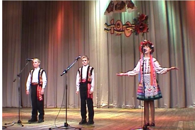
Діти українського відділення павлодарської школи національного відродження читають вірші Тараса

Демонстрували свою читацьку майстерність і переможці декляматорських конкурсів.