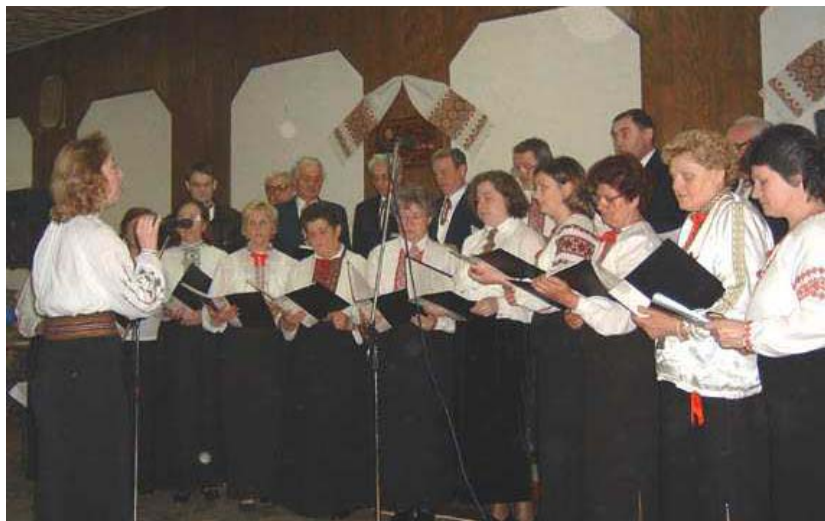
Співає хор "Карпати"