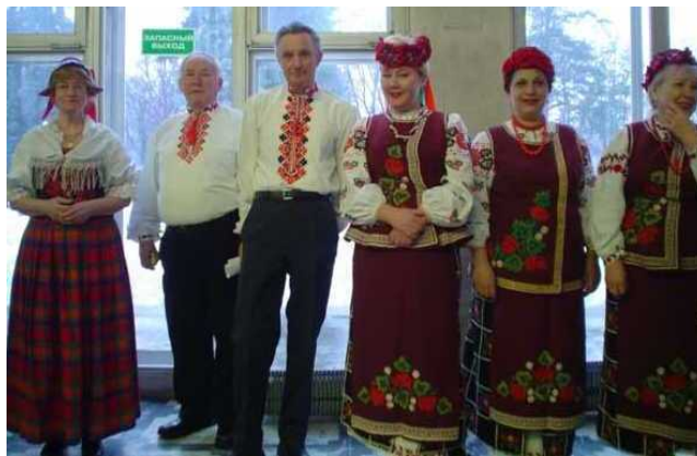
Учасники Української народної хорової капели на з'їзді

Музичне вітання з'їзду пролунало у виконанні художніх колективів національно-культурних об'єднань Москви, зокрема Української народної хорової капели.