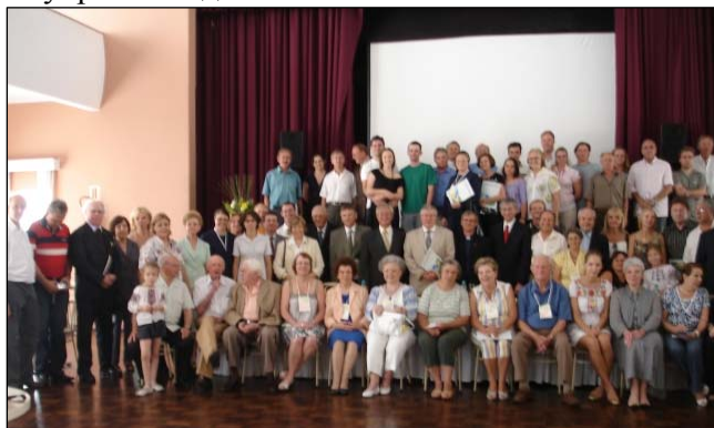
Делегати та учасники VII Конгресу УБЦР та IV Зустрічі українців Південної Америки

31 січня і 1 лютого президент СКУ взяв участь у VII Конгресі Українсько-Бразилійської Центральної Репрезентації та у IV Зустрічі українців Південної Америки, що пройшли в м. Куритиба, штат Парана (Бразилія). Крім делегатів, на цих заходах були присутні владики українських церков, представники федерального, провінційного і місцевого урядів та українські дипломати.