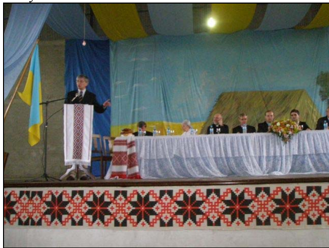
Президент СКУ Євген Чолій виступає на XXXVI Конгресі української молоді Бразилії

7 лютого президент СКУ завітав на XXXVI Конгрес української молоді Бразилії, який проходив у м. Уніао-да-Віторія, штат Парана (Бразилія). Виступаючи з промовою перед більш ніж 400 представниками молодого покоління, президент СКУ розповів про обсяг праці СКУ та закликав молодь долучатись до активного життя української громади в Бразилії та покращувати знання української мови для спілкування з українською молоддю усього світу.