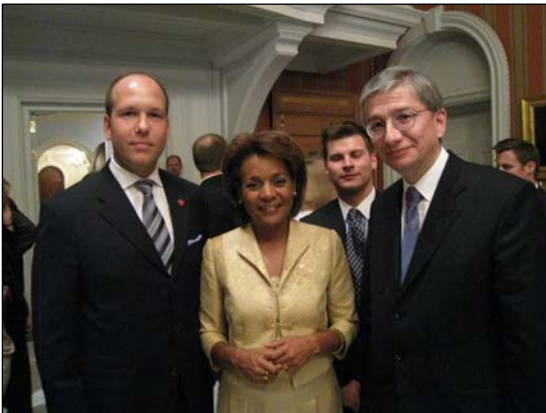
На фото (зліва направо): президент Конгресу Українців Канади Павло Грод, Генерал-губернатор Канади Мікаель Жан та президент Світового Конгресу Українців Евген Чолій

15 квітня 2009 р. президент Світового Конгресу Українців Евген Чолій узяв участь у культурному заході в резиденції Генерал-губернатора Канади Мікаель Жан з нагоди її державного візиту 23-26 квітня 2009 р. в Україну.