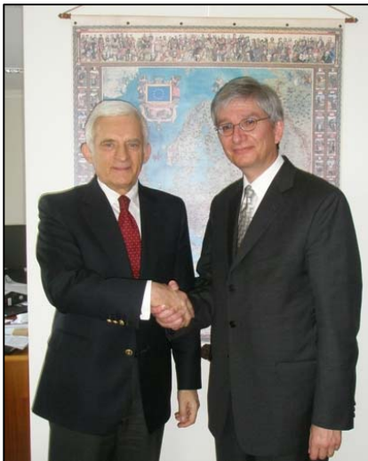
На фото: Є. Бузек та Е. Чолій

28-29 березня 2012 р. у Європейському Парламенті в Брюсселі Євген Чолій зустрівся з колишнім Президентом Європейського Парламенту Єжи Бузеком, віце-президентом Європейського Парламенту Яцеком Протасевичем, головою делегації Європейського Парламенту до Комітету парламентського співробітництва ЄС-Україна Павлом Ковалем, з депутатами Європейського Парламенту Тунне Келамом і Яном Козловським, з членом Кабінету комісара з питань розширення та європейської політики сусідства Європейської Комісії Івоною Пйорко та з членом Кабінету Президента Європейської Ради Мікаелою Кумлін-Граніт.